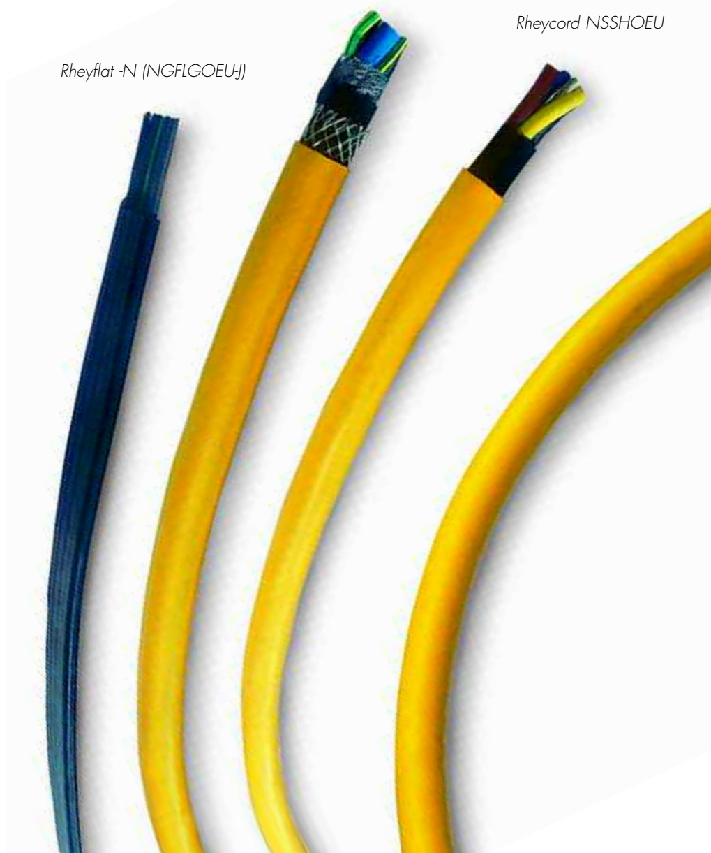
Rheyflat -N (NGFLGOEUJ)