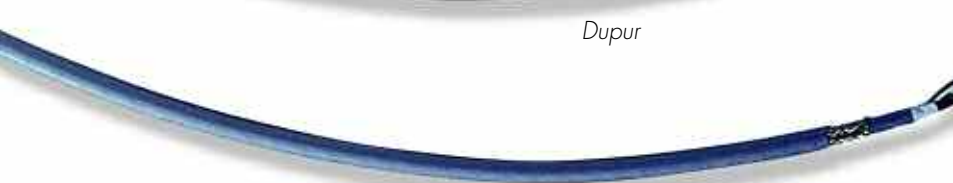
Ultraflex -YCY (S05WC4V5-H)